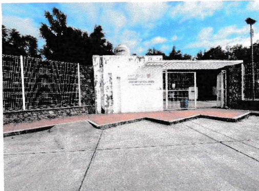
Cajón de estacionamiento con rampa para silla de ruedas (29/09/2025)