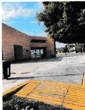
Rampa de acceso (29/09/2025)