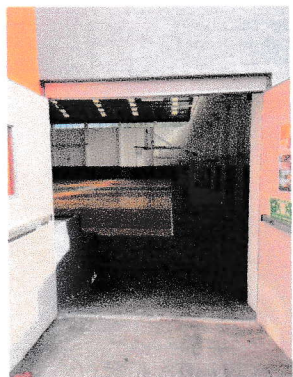
Rampa de acceso a cancha