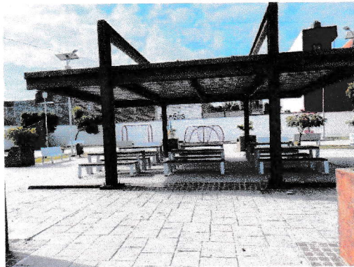
Rampa para acceso a área de comedores (29/09/2025)

Moroleón, Gto. 29 de septiembre del 2025