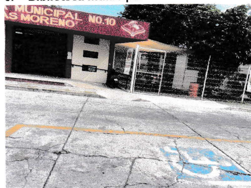
Cajón de estacionamiento preferencial