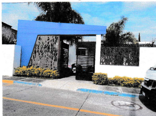
Acceso al centro (29/09/2025)