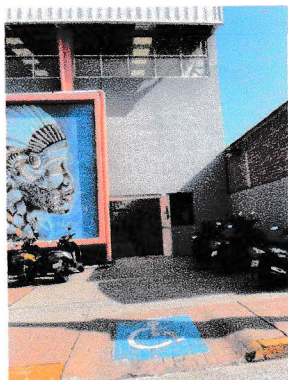
Rampa de acceso

Moroleón, Gto. 29 de septiembre del 2025