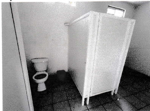
Baño para personas con capacidades diferentes (29/09/2025)