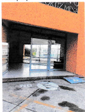
Rampa de acceso interno (29/09/2025)