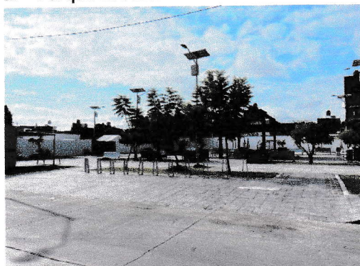
Acceso sin obstáculos (29/09/2025)