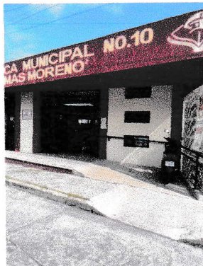
Rampa de acceso

Moroleón, Gto. 29 de septiembre del 2025