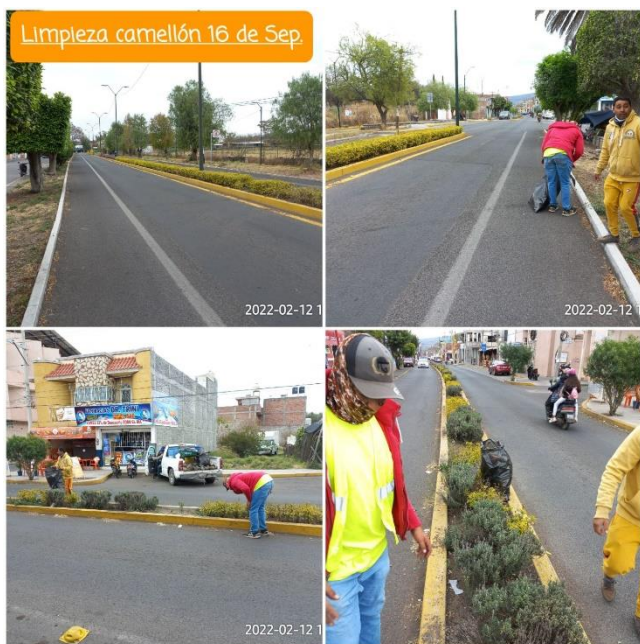
Limpeza camellón 16 de Sep.