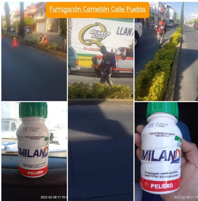
Fumigación Camellón Calle Puebla

Dirección de Servicios Públicos Municipales de Moroleón, Av. Ponciano Vega No. 972, Fundadores de Moroleón, C. P. 38800 Tel. 445 45 8 92 10 / serviciospublicos.moroleon@gmail.com