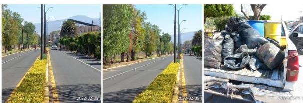
Limpeza de camellón 16 de Sep.

<<2022 año del Festival Internacional Cervantino, 50 años de diálogo cultural>>