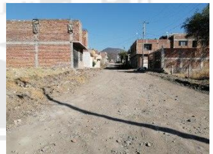
PAVIMENTACIÓN DE LA CALLE LOMAS DEL TEPEYAC EN EL MUNICIPIO DE MORELÓN, GTO.

Número de Contrato: PMM/DOPM/LS/PEMC/PAV-LOMASTEPEYAC/2020-04