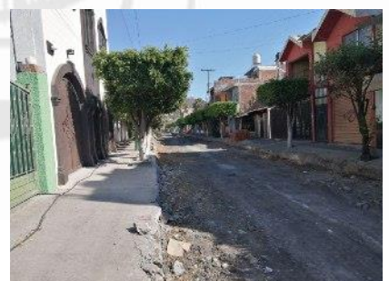
PAVIMENTACIÓN DE LA CALLE TEPEYAC EN EL MUNICIPIO DE MORELÓN, GTO.

Número de Contrato: PMM/DOPM/LS/PEMC/PAV-TEPEYAC/2020-06.