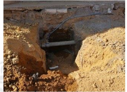
PAVIMENTACIÓN DE LA CALLE JOSÉ TORRES LANDA EN EL MUNICIPIO DE MORELÓN, GTO.

Número de Contrato: PMM/DOPM/AD/PEMC/PAV-TORRESLANDA/2020-07.