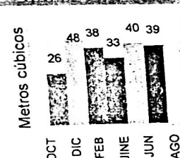
GRAFICO DE CONSUMO